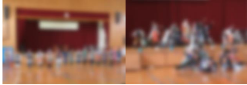
「6年生、ありがとう!」【6年生によるソーラン】

3月1日(金) 2, 3限に、「6年生を送る会」を行いました。代表委員会で企画立案し、全体的には5年生がリーダーシップをとって進めて、1~5年生は準備や練習に一生懸命に取り組んできました。前日2月29日に、4, 5年生が一生懸命に体育館の飾りつけを行い、準備万端で当日を迎えました。5年生の司会・進行で「6年生を送る会」が始まりました。各学年の出し物、6年生チャレンジのじゃんけん列車(「6年生を送る会」バージョン)、6年生の八幡ソーランがありました。八幡小のみんなが6年生をととても大好きなんだということが送る会を通して伝わってきます。これらは、これまでの6年生の日常の振る舞いや何事にも一生懸命にとりくむ姿がいかにかすてきてあったかを物語っています。6年生、今まで本当にありがとう!