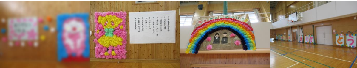
【5年生からのメッセージ】 【「6年生を送る会」会場(体育館)の飾りつけ】