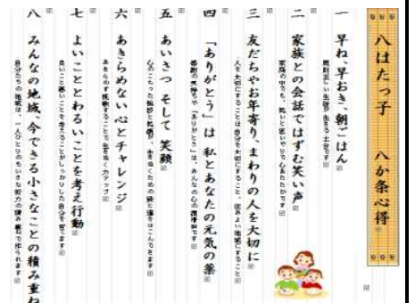
【八はたっ子 八か条心得(仮)】

来年度からの地域運営学校（コミュニティスクール）の発足を目指して、昨年11月28日(水)には、遠賀郡水巻町の猪熊小学校での「熟議」(みんなでしっかり話し合うこと)の様子を、八幡小コミュニティスクール推進委員さん12名で視察をしてきました。そして、現在視察を生かして、「めざす八はたっ子」の原案づくりの熟議を深めています。(右は、熟議のためのたたき台として「八か条心得(仮)」を提案しているものです)