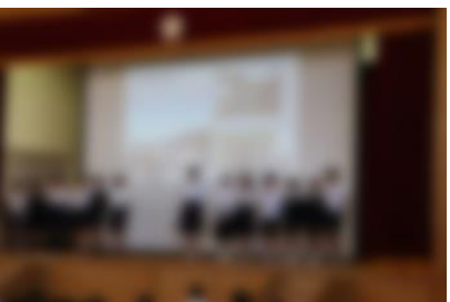
[ 5年生 ]