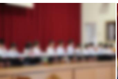
[ 1年生 ]