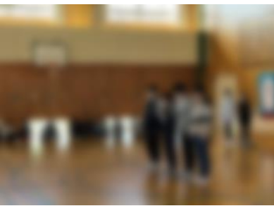
[ 6年生のこぼれ ]

スライドショーが終わり、くす玉の懸垂幕に『最後に6年生のソーラン節が見たい』。5年生が準備していたハッピーが6年生に渡されると会場にはソーラン節が流されました。すると、6年生だけではなく、子どもたち全員が舞い踊りはじめ、とても感動的な場面でした。これは、6年生のこれまでの頑張りやその姿が、下級生の憧れであり、よきモデルとなっている証です。