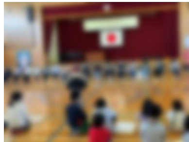
[ 開会 ]