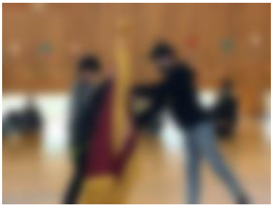
[ 校旗わたし ]