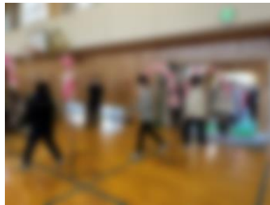
[ 6年生入場 ]

1~4年生による歌やダンス、クイズなどでの6年生への思いを込めた出し物があり、どの学年からも6年生への手作りのプレゼントが渡されていました。5年生からは、6年生の思い出をまとめたスライドショーが6年生に贈られ、6年生をはじめ全校の子どもたちや先生方が一つになってスクリーンを見つめていました。