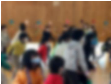
[ 八幡ソーランをみんなで ]