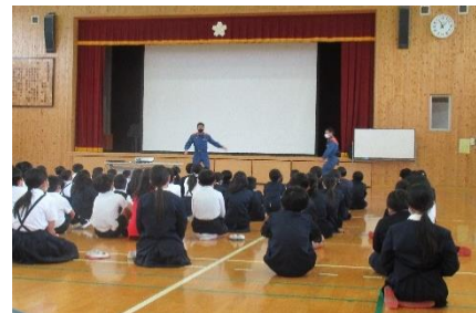
【火災避難訓練】消防士のお話

最後になりましたが、4月23日に授業参観・学級懇談会・PTA総会・児童引き渡し訓練では、多数のご出席とご協力をいただき、ありがとうございました。そして、4月26日の児童引き渡しにおきましても、ご理解