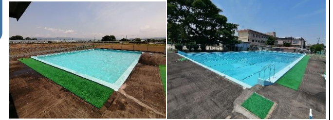
(きれいになった小プールと大プール)

6月9日(木)は、プール開きでした。3校時に低学年、4校時に中学年、5校時に高学年と行いました。プール開きに向けて、子どもたちと先生方で、プールサイドの除草やプールの清掃を行いました。約1年分の汚れがあって大変でしたが、どの学年も一生懸命にとりくみ、プールは見ちがえるぐらいにとってもきれいになりました。これで、プールでの水泳の授業を楽しむことができるようになりました。プール開きでは、プールでの注意事項をしっかりと聴き、バディを組んで、初日のプールを楽しんでいました。