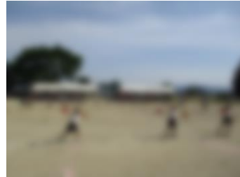
【キラキラおひさまダンス】