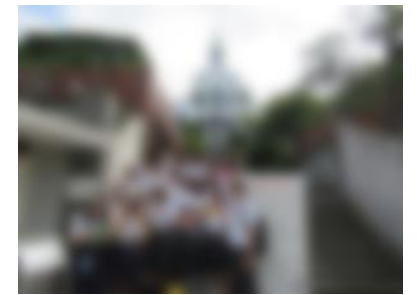
【 大浦天主堂 】