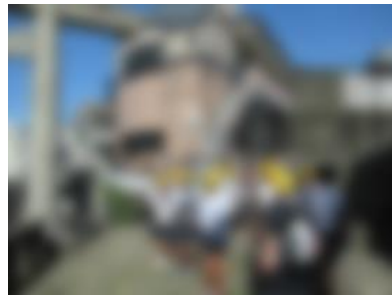
【 一本柱鳥居 】