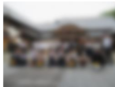
【 長崎歴史文化博物館 】

1泊2日の長崎の旅。6年生が時間をきちんと守ったおかげで、行程はほぼ予定通りに進めることができました。1日めは、原爆や戦争の恐ろしさ、平和の大切さについて学びました。6年生が一生懸命に遺構や資料を見たり、一生懸命に説明や講話を聴いたりしている姿が印象的でした。2日めの班別でのフィールドワークでは、班のみんなが一つになって行動していることや協力している様子が遠くから見てもわかるぐらい、気持ちよく活動することができていました。また、旅行中、いつも笑顔があり、友だちを気づかう場面がたくさん見られました。“すてきな6年生”を新たに発見するとともに、修学旅行1泊2日の短い間において6年生の一人一人が少し成長したことを実感することができた修学旅行となりました。