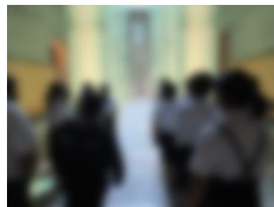
【 折り鶴奇贈 】