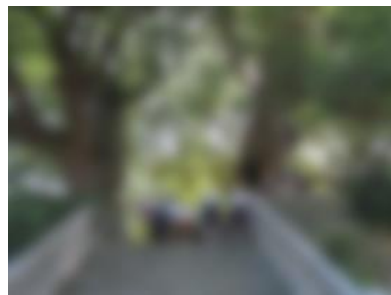
【 山王神社のクスノキ 】