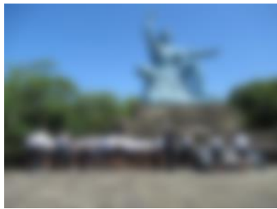
【 平和祈念館 】