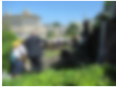
【 浦上天主堂 】