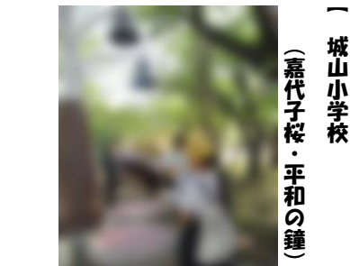
【 城山小学校 (嘉代子桜・平和の鐘) 】