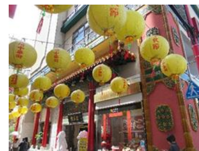
【 新地中華街 】