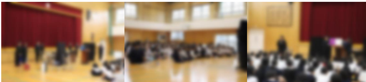
【八幡ドリームブックのみなさん】 【読書集会の はじまり～ はじまり～】 【「ハロウィンのかくれんぼ」】

八幡小のみんなで楽しんだ読書集会。本の魅力や読書のよさをみんなで感じたひと時でした。八幡ドリームブックのみなさん、すてきな読み聞かせをありがとうございました。