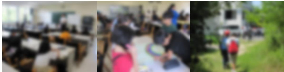
[ 入所式、オリエンテーション ] [ 班のみんなで力を合わせて ] [ フィールドビンゴ ]

フィールドビンゴ、野外炊飯、キャンプファイアー、海水浴それぞれの活動を参加者全員が一生懸命に取り組んでいました。互いによく声をかけあうことができている、気持ちよ