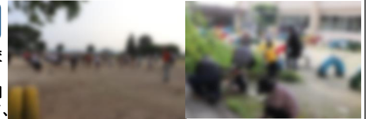
[ みんなでラジオ体操 ] [ 除草作業、側溝の土砂上げ ]

7時10分に開会し、みんなで朝のラジオ体操を行いました。そして、校舎内・体育館・中庭・運動場を分