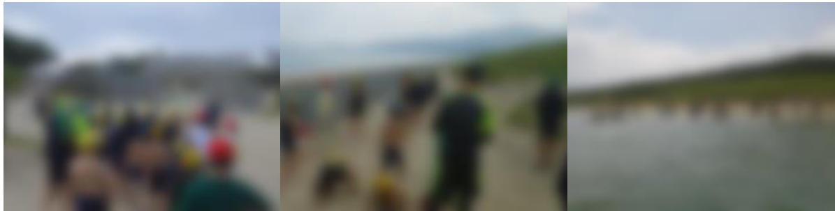
[ 海水浴オリエンテーション ] [ みんなで浜辺をきれいに ] [ 海水浴で夏の海を満喫 ]

く協力している姿がたくさん見られ、いろんな場面で笑顔・笑顔・笑顔だったことが印象的でした。1泊2日の宿泊体験学習で見せてくれた4、5年生のすてきな力をこれからの学校生活でも一生懸命に発揮し、個々人の成長とともに八幡小をよりよくしてくれることに期待しています。