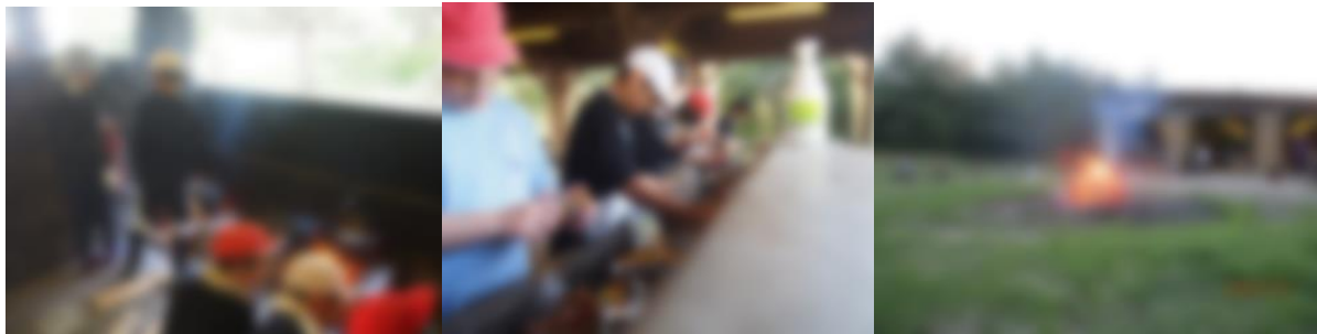
[ 野外炊飯 カマド ] [ 野外炊飯 食材準備 ] [ キャンプファイアー ]